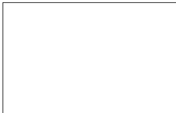
Место для подписи

Примечание: подпись должна иметь четкие, хорошо различимые линии, ставиться черными чернилами, занимать 80% выделенной области и не выходить за пределы рамки.